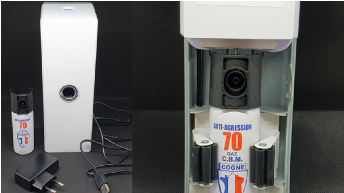
Diffuseur gaz lacrymogène et sa cartouche de recharge.

Présentation vidéo des avantages du diffuseur lacrymogène sur alarme intrusion